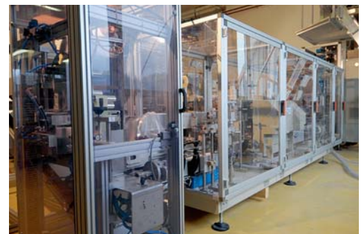
Ein in sich geschlossenes System: die Anlage für die neue, innovative Folien-Vakuumverpackung.

Suchen Sie eine umfassende Gesamtlösung für Ihr Produkt oder benötigen Sie unsere Beratung und unser Know-how für einen bestimmten Produktionsbereich? Gemeinsam finden wir die passende Lösung.